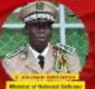
Minister of National Defense