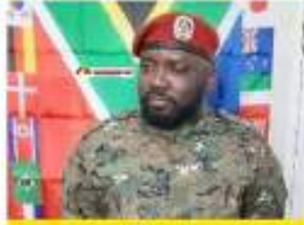
MDP Limit DOUMBOUTA MOVEMENT MUST GO STOP