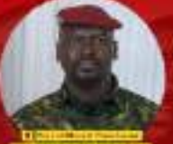
President of the CNRD