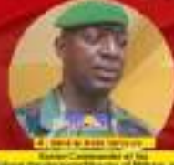
National Secretary for the National Committee of the Forces Vives