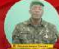
National Secretary for the National Committee of the Forces Vives